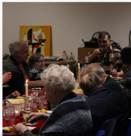
Det er tid til madro