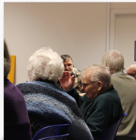
Og så kører snakken igen!