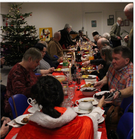
Og maden sendes rundt