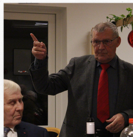
Der holdes tale