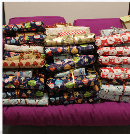
Gaverne er pakket ind