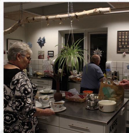
De frivillige tilbereder maden