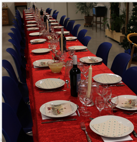
Der er dækket fint bord