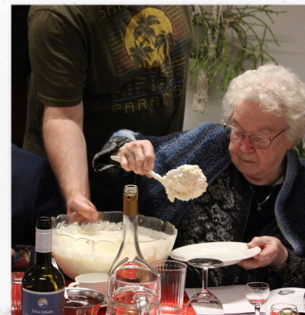
Der kæmpes for mandlen