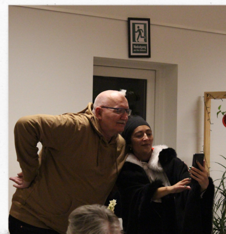
... Og der tages billeder

Tusind tak til alle sponsorer, gæster og frivillige