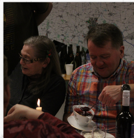
Der er selvfølgelig risalamande