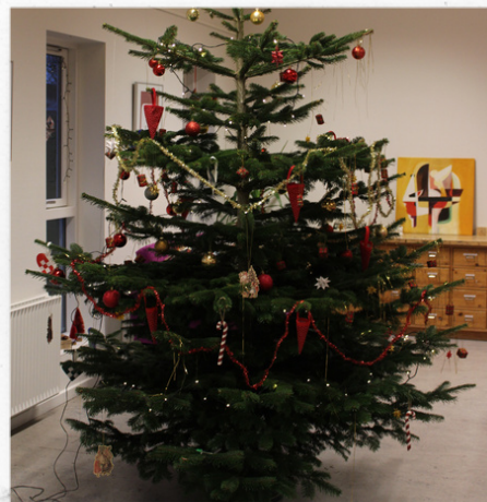
Juletræet er pyntet